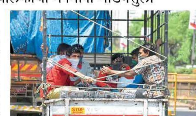
मुंबई : खासगी वाहनाने प्रवास करताना परप्रांतीय कामगार.

Mahatransco Website http://srmetender.mahatransco.in for the following Tender